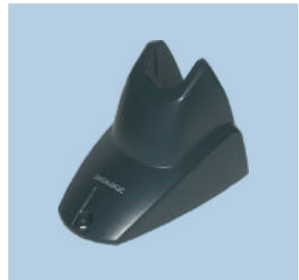
STD Heron™, Ständer für den Freihandbetrieb, optional erhältlich mit Metallplatte